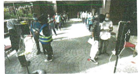
ORANG ramai beratur untuk mendapatkan vaksin selepas janji temu sempena vaksinasi secara walk-in di Rumah Prihatin Hotel Grand Seasons KL, semalam.

Beliau berkata demikian ketika ditemui media di Pusat Vaksinasi Grand River-view Hotel (GRV) di sini, semalam.