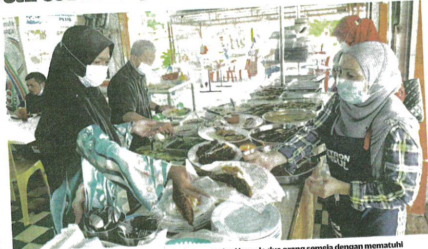
PELANGGAN boleh menjamu selera di premis dengan terhad kepada dua orang semeja dengan mematuhi penjarakan fizikal di negeri Fasa Ketiga PPN. – GAMBAR HIASAN

Beliau berkata, sidang mesyuarat itu turut membincangkan kemudahan yang bakal