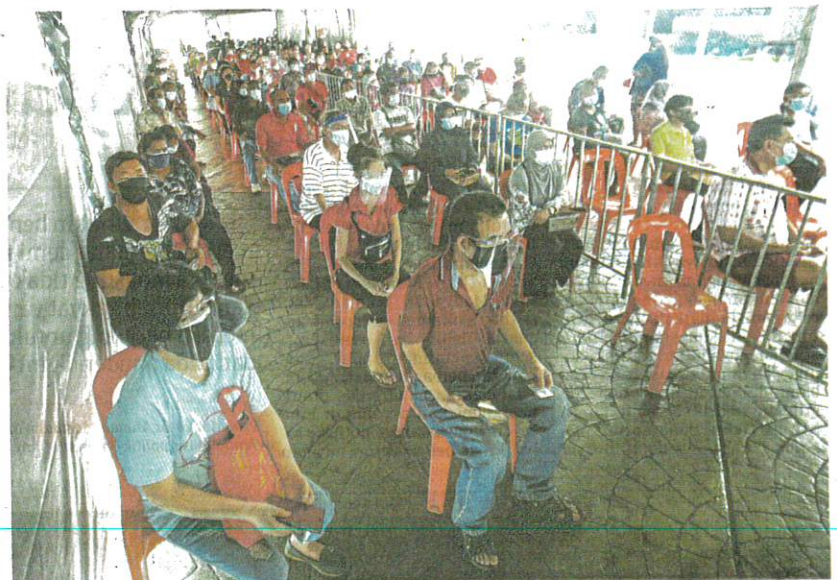
Orang ramai menunggu giliran menerima vaksin secara jumpa terus khusus untuk individu berusia 40 tahun ke atas di Klang, semalam.

Sehubungan itu, katanya, Badan Bertindak Imunisasi COVID-19 (CITF) membuat keputusan supaya kaedah pemberian vaksin secara jumpa terus yang dilaksanakan di Lembah Klang, diperluas di semua negeri.