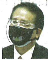
Tan Sri Dr Noor Hisham Abdullah

Three high-risk group clusters were the Jalan Pekan Baru cluster in Selangor, Jalan Hospital Bandar Kota Baru cluster in Kelantan and Jalan Temenggong Ahmad in Johor. The education and religious cluster were both reported in Kelantan, namely Kampung Dalam Rhu Tumpat and Kampung Belukar Kadok in Kota Baru.