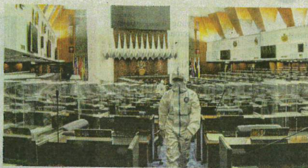
Empat sampel genom kes positif Covid-19 di Parlimen hasil saringan pada 29 Julai lepas berkemungkinan besar adalah varian Delta.

"Kami melakukan satu cerakin pengenotipan PCR (tindak balas rantai polimerase) yang boleh memberikan keputusan andaian untuk varian yang membimbangkan (VOC) atau yang perlu diberi perhatian (VOI) dengan penjujukan genom penuh (WGS) meng-