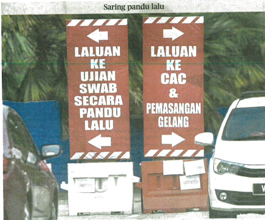
ORANG ramai yang menaiki kenderaan keluar dan masuk di laluan ke Pusat Penilaian Covid-19 (CAC) Daerah Sepang di Stadium Mini Bandar Baru Salak Tinggi, bagi menjalani penilaian dan pemeriksaan kesihatan ketika pada tinjauan media, kelmarin.

Belum ada keputusan mengenai pemberian suntikan dos penggalak