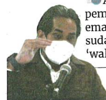
Khairy Jamaluddin, Menteri Penyelaras Program Imunisasi COVID-19 Kebangsaan

Ada negeri yang sudah mula pemberian vaksin kepada warga emas secara 'walk in', ada yang sudah bersedia untuk terima 'walk in' bagi warga emas