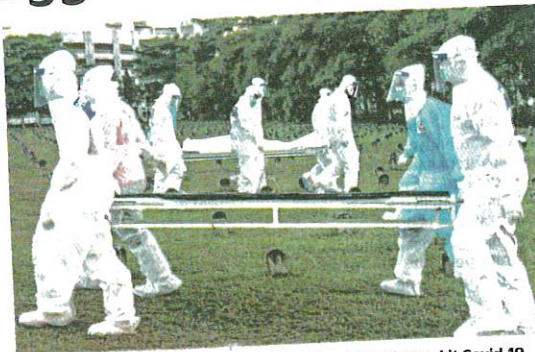
PETUGAS bertungkus-lumus mengebunkan jenazah pesakit Covid-19 di Tanah Perkuburan Bukit Kiara, Kuala Lumpur.

"Ia melibatkan 105 kes di Selangor, Kuala Lumpur (41 kes), Johor (24 kes), sembilan kes di Melaka, lapan kes di Pahang, tu-