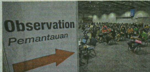
Penerima vaksin diminta untuk berehat dan dipantau selama 15 minit oleh para petugas selepas divaksinasi di Pusat Pemberian Vaksin (PPV) Pusat Konvensyen Kuala Lumpur pada Isnin.

"Ini adalah berdasarkan keadaan klinikal kes semasa baharu didiagnosa Covid-19," kata-