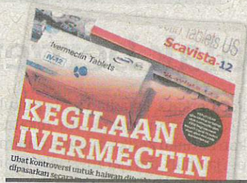
KERATAN Kosmo! 31 Julai 2021.

“Ubat ini berbahaya diambil jika tiada pengawasan, kita kena